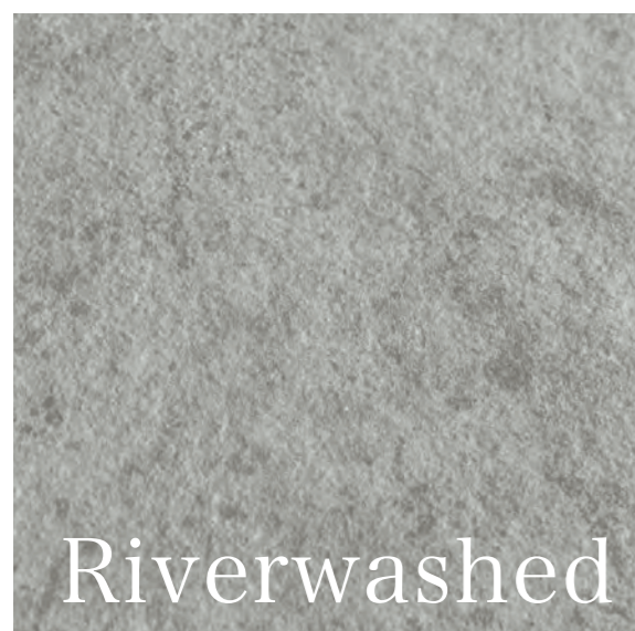
リバーウォッシュ仕上げ

リバーウォッシュ仕上げは、凹凸のある表面や自然な手触りが特徴です。石材のピシヤン仕上げやアンティーク仕上げと比較しても、ネオリスのリバーウォッシュ仕上げの自然石のような風合いはそれらを凌駕できます。