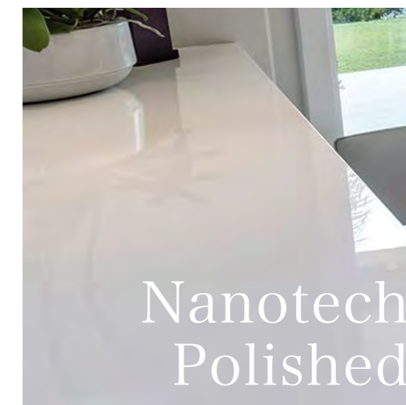
ポリッシュ仕上げ（ナノテック）

輝度レベルの高い直磨き（ナノテック）ポリッシュ仕上げは、単色のモデルをより洗練されたイメージに引き上げます。