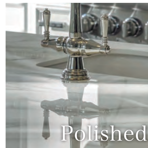
ポリッシュ仕上げ（ガラス層）

大理石シリーズには、ガラス層のポリッシュ仕上げが高級感を際立たせます。美しい鏡面反射がデザインに輝き・深みを与え、豪華さを醸し出します。