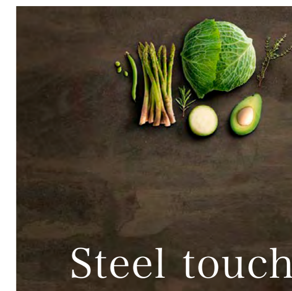
スチールタッチ仕上げ

メタリック調のスチールタッチ仕上げは、柔らかな反射とフラットな表面で現代建築に個性と都会的な要素を加えます。