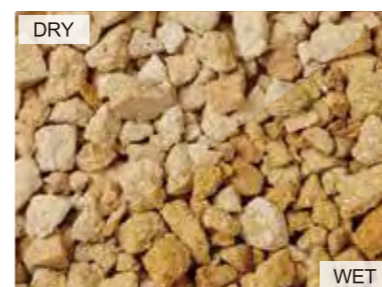
EN4003 イエロー 中国 10kg/袋 /φ20mm 内外