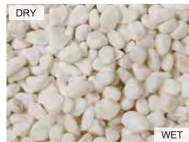
EN0012 キュイジーホワイト 中国 20kg/袋 /φ20mm 内外