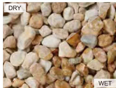
EN0014 キュイジーイエロー 中国 20kg/袋 /φ20mm 内外