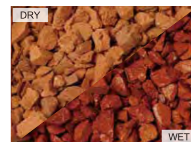
EN4004 レッド 中国 10kg/袋 /φ20mm 内外