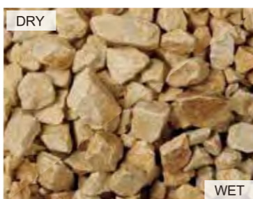
EN1003 フレデリックイエロー 日本 20kg/袋 /φ20mm 内外