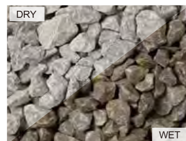
EN1002 フレデリックシルク 日本 20kg/袋 /φ20mm 内外