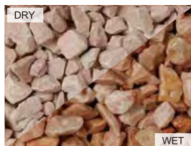
EN1001 フレデリックピンク 中国 20kg/袋 /φ20mm 内外