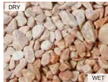
EN0015 キュイジーピンク 中国 20kg/袋 /φ20mm 内外