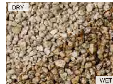
EN3002 伊勢砂利 日本 18kg/袋 /φ12mm 内外