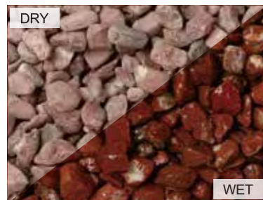
EN0011 キュイジーレッド 中国 20kg/袋 /φ20mm 内外