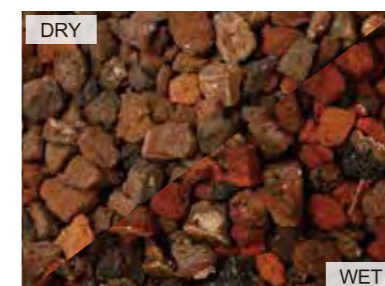
EN4002 ダークブラウン 中国 10kg/袋 /φ20mm 内外