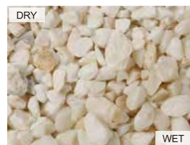
EN1005 フレデリックホワイト 日本 20kg/袋 /φ20mm 内外