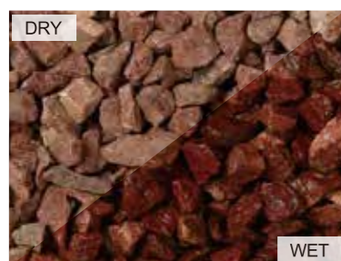
EN1004 ワインレッド 中国 20kg/袋 /φ20mm 内外